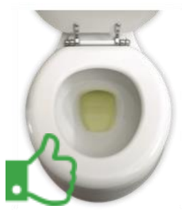
Geel en helder