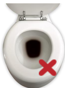
Donker en troebel